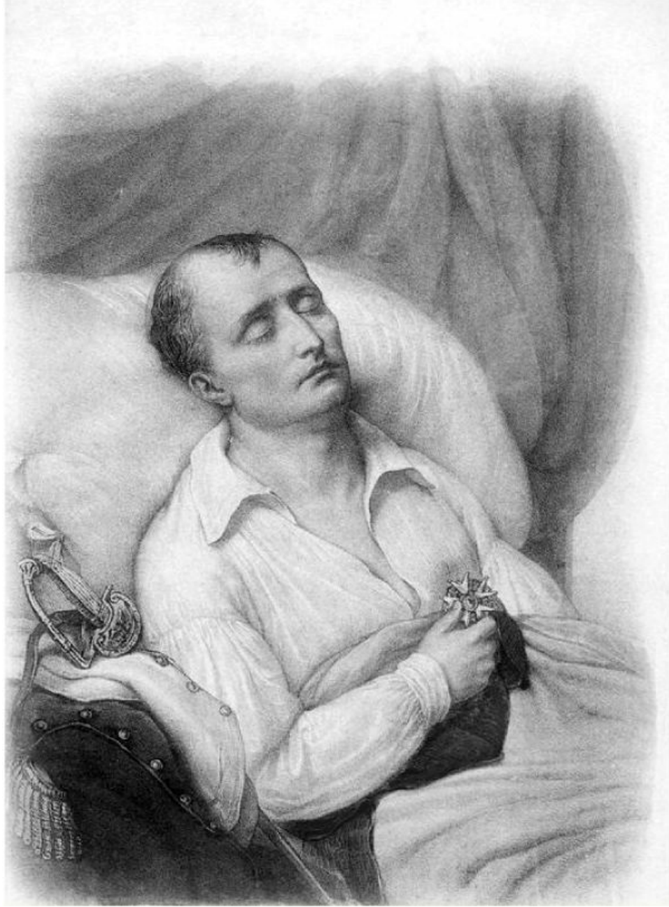
نابليون ميثًا وكفّه على وسام اللجيون دونور الذي أنشأه.