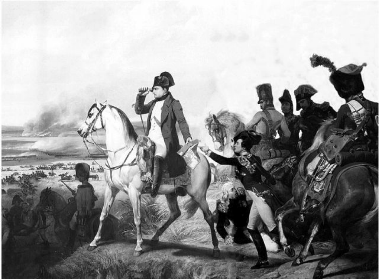
نابليون في واقعة واجرام.

كان اليوم يوماً عبوساً قمطيرياً أرعدت السماء فيه إرعاداً أسكت أصوات المدافع، ووقف الناس ولداناً شيباً فوق سطوح المنازل في فيينا وقد ملك الرعب قلوبهم حتى يكاد يتدفق الاصفرار منها وهم ينظرون إلى ملتحم الجيشين. وقف أربعمئة ألف من الأرواح في حومة الوغى حتى إذا انتصف النهار سقط قلب الجيش النمساوي وتشتت، فلما رأى الإمبراطور النمساوي ذلك، وكان يشاهد تلك المناظر المفزعة من جبل بجوارها، فقَدَّ رشده فحوّل بصره عن مشهد الدماء والهزيمة وغادر مكانه إلى حيث أراد.