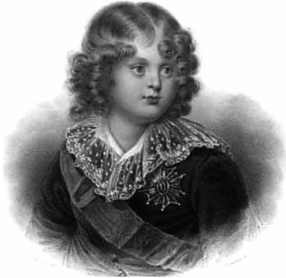
ابن نابليون — أو — ملك روما.