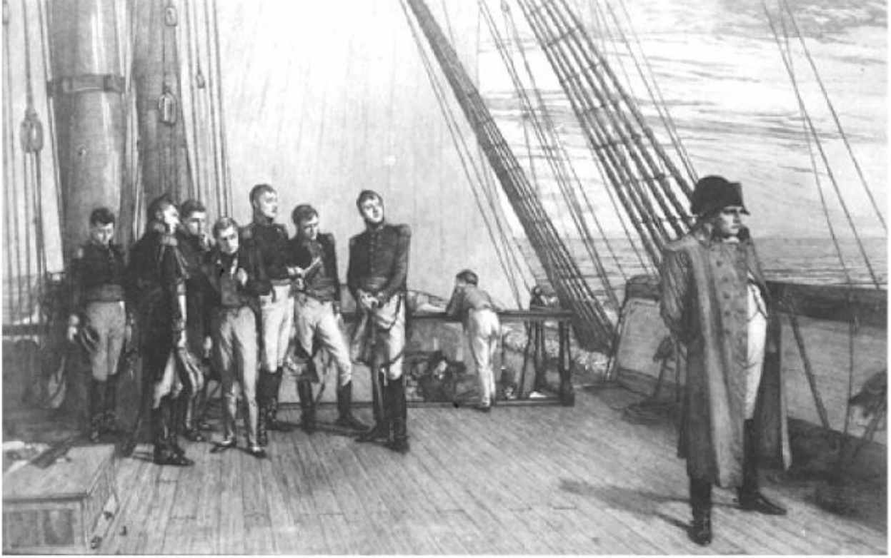
نابليون على ظهر الباخرة.

تفجرت الحفيظة من قلوبهم، وأذنت في البلاد بالثورات.»