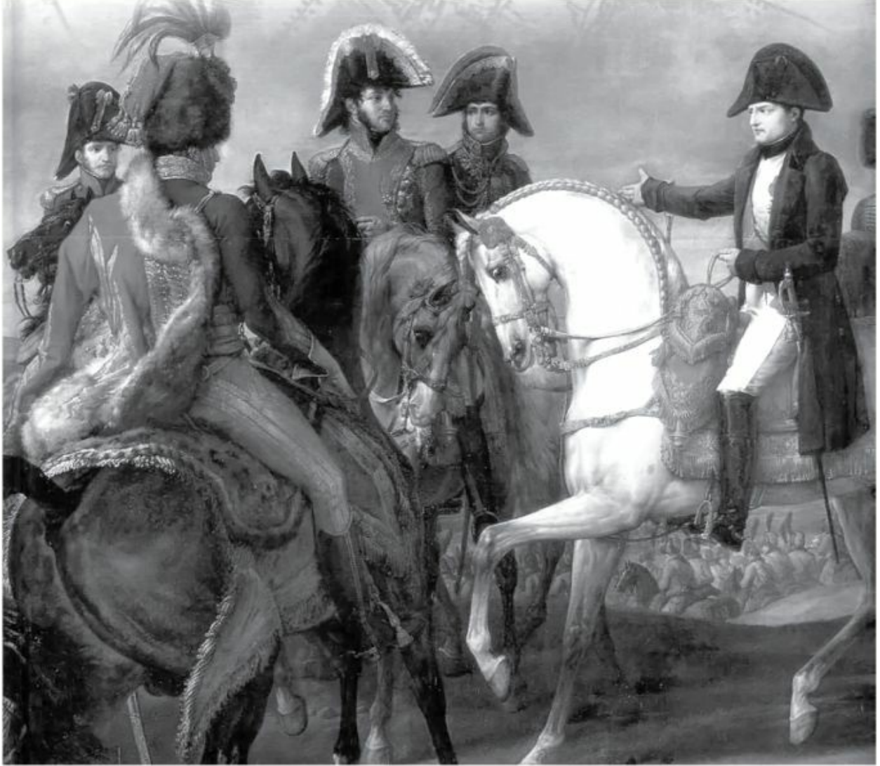
نابليون في واقعة أسترلنز.